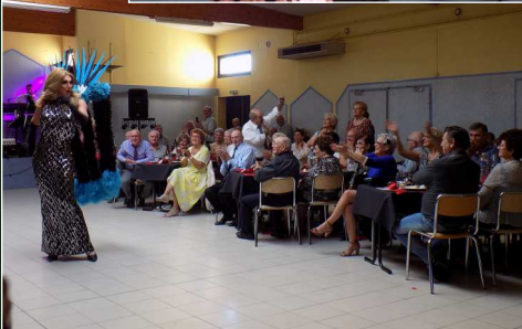
Repas des anciens