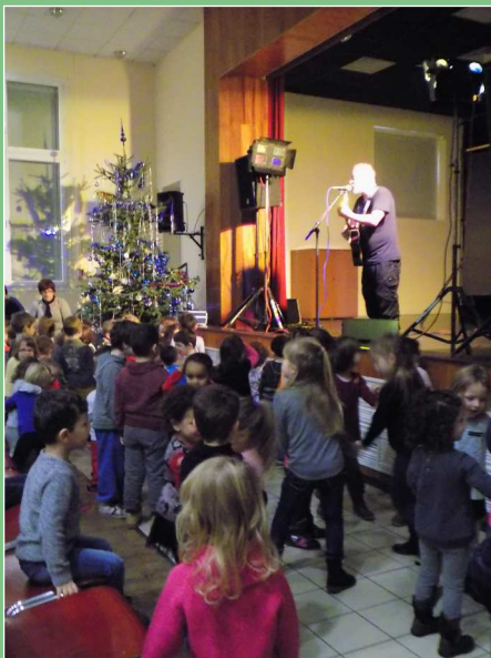
Spectacle à la salle des fêtes