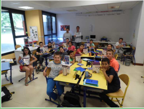
Remise de dictionnaires aux élèves de CM2