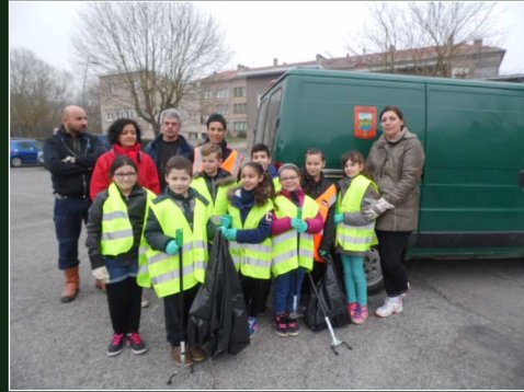
Nettoyage de printemps