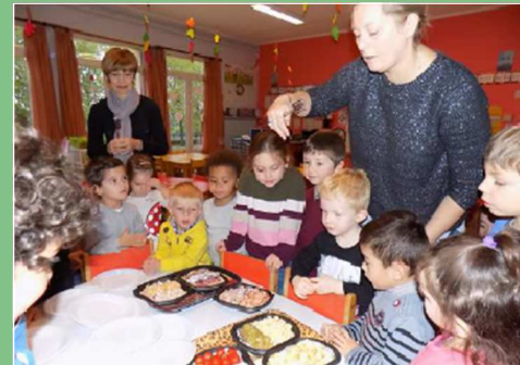
Semaine du goût dans les écoles