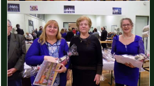
Réception des sportifs et bénévoles méritants