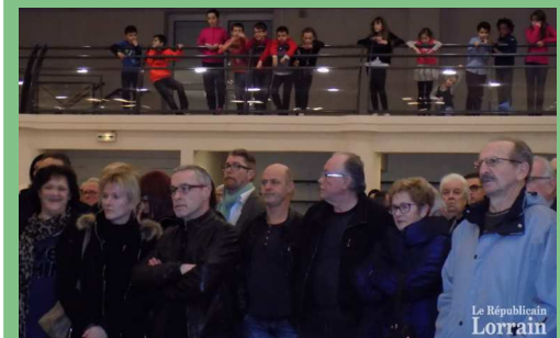
Cérémonie des vœux du Maire