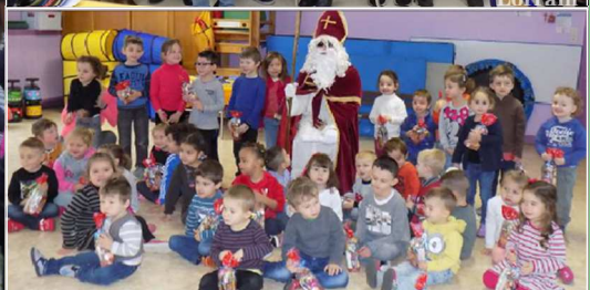
Passage du Père Noël dans les écoles