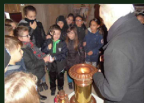
Récupération de la flamme à Verdun